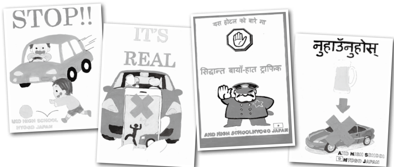
ネパール交通安全ポスター

◆所感◆ 生徒たちの作品は、表現力豊かで、オリジナリティに溢れていた。自分たちができることを切り口に、世界とつながっていくことは、とても良い教育活動だと感じた。また、すべての作品が完成していないが、完成したら是非、全作品をネパールに送りたい。