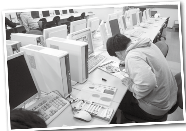
ポスター作成の様子