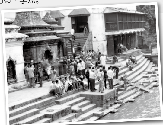
パティパシュナート

研修で訪問した場所や施設を切り口にネパールの諸事情について学んでいく。日本の生活文化と比較しながら、ネパールの特徴を把握する。