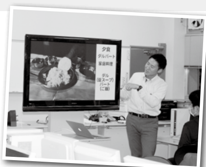
ネパールの家庭料理について

ネパールの交通事情が電力問題、大気汚染とも関係していることに気づかせる。 発展途上国では複数の問題が複雑に絡みあっている事を知る。